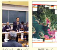
タウンミーティング 防災マップ