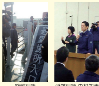
避難訓練 中村知事