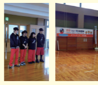
第3回ダブルダッチ講習会