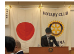
ロータリークラブ最終例会