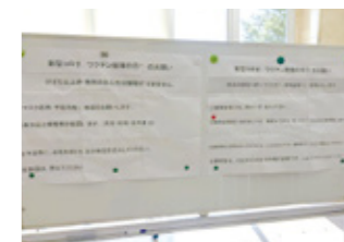
コロナワクチン接種 (宇和島徳州会病院)