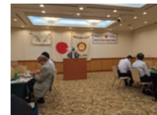
ロータリークラブ新年度例会